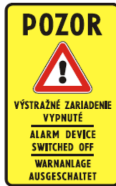
IP 30a Výstražné zariadenie vypnuté

43. V prílohe č. 1 I. diele I. časti bode 5 sa za vyobrazenie dopravnej značky č. IP 30 vkladá vyobrazenie novej dopravnej značky č. IP 30a: